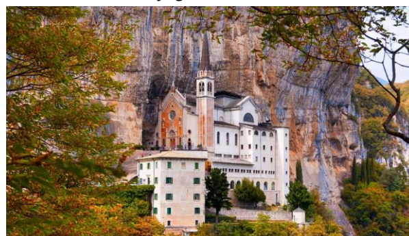
Santuario della Madonna della Corona

Nella prima mattinata si prende la via del ritorno con sosta al paese di Brentino. Si percorre il Sentiero della Speranza- Madonna della Corona: km 2,5 in salita con dislivello di 600 mt. (circa 1500 gradini) e ritorno. Visita del Santuario della Madonna della Corona magnifica costruzione del XVI secolo incastonata nella roccia