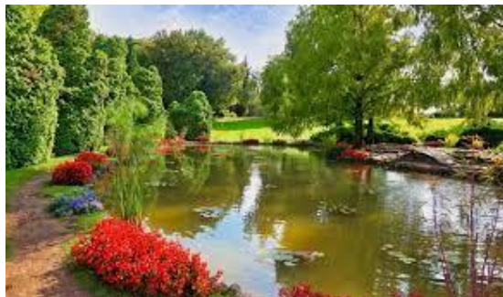
Veduta del parco Sigurtà a Valeggio sul Mincio

Da metà mattinata trascorreremo alcune ore nello splendido parco Sigurtà a Valeggio sul Mincio dove faremo la sosta pranzo. Nel pomeriggio visita di Borghetto sul Mincio , tra i borghi più belli d'Italia, situato nei pressi del parco. Dopo una rinfrescante merenda nel caratteristico borgo proseguiremo per Andalo per la sistemazione in albergo.