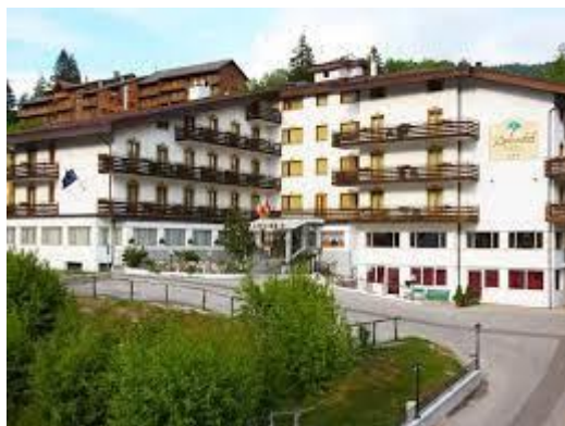
Hotel Splendid ad Andalo

Sistemazione in camere matrimoniali e doppie