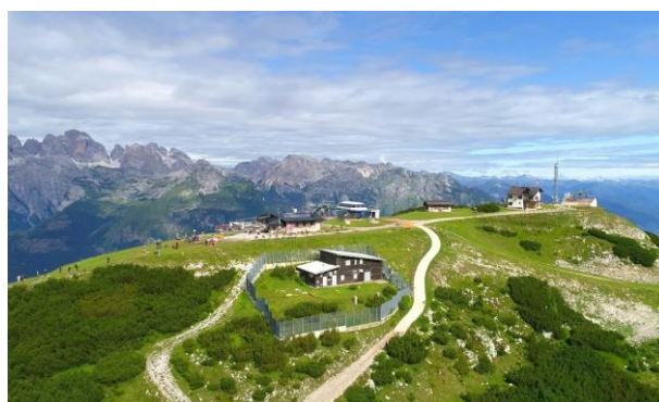
Rifugio La Roda

Andalo – Dos Pelà (in cabinovia) – Bait del Germano – Passo S. Giovanni – Gaggia – ritorno ad Andalo in cabinovia (km 15,3)